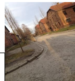
Photo prise le 14 janvier 2015 dans le camp d'Auschwitz